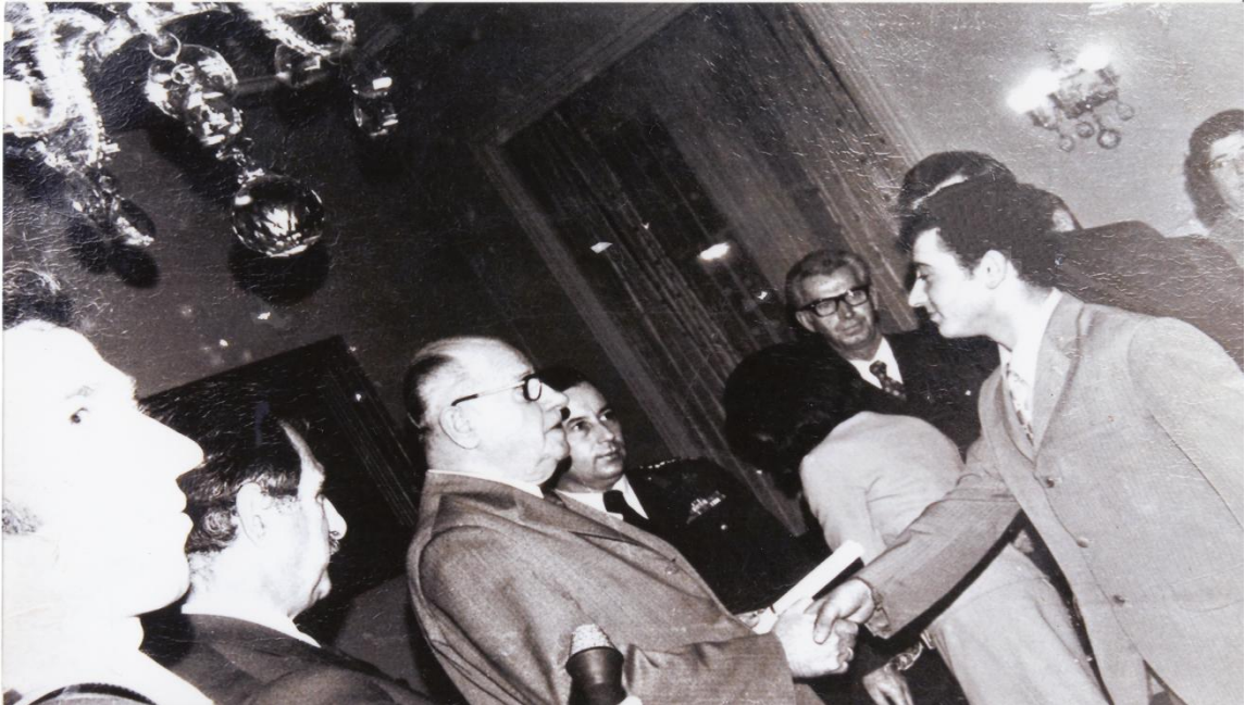
CUMHURBAŞKANIMIZIN KABULÜ 15. 12. 1972