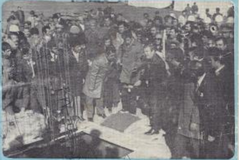
SANAYİ VE TEKNOLOJİ BAKANI SAYIN MESUT EREZ TEMELİ HAKI ATARKEN

DIYARBAKIR İPLİK FABRİKASININ TEMELİ ATILDI